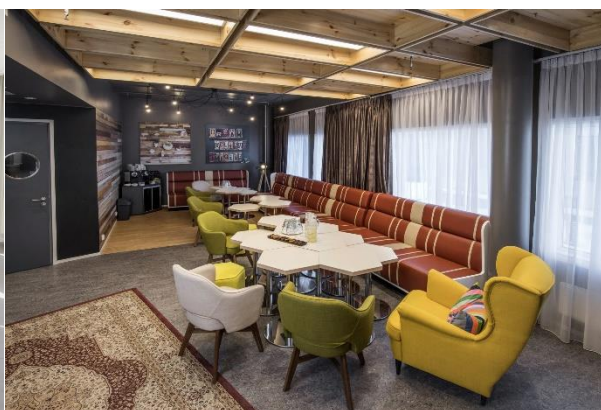
HUONE Jätkäsaari: Vintage