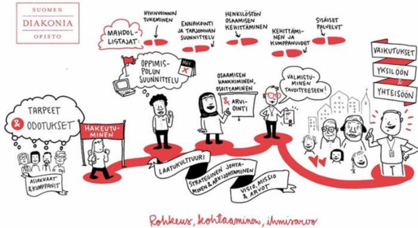
Kuva 8. SDO:n prosessikartta, Opiskelijan polku.

Opiskelijan (asiakkaan) polulta löytyvät SDO:n ydinprosessit: koulutusten suunnittelu, palveluihin hakeutuminen, asiakkaan yksilöllisen polun suunnittelu, aiemmin hankitun osaamisen tunnistaminen, uuden osaamisen hankkiminen ja osaamisen osoittaminen sekä arviointi. Näiden lisäksi on intran Opetus- ja ohjaus löytyvät opiskelijoiden hyvinvointia ja eri oppimisympäristöihin liittyvät toimintalinjaukset.