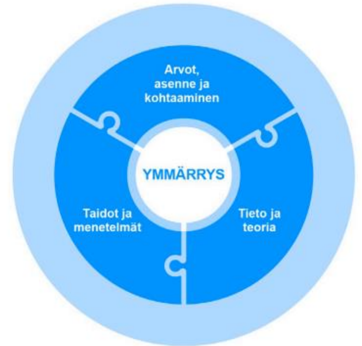
Kuvio 3. Osaamisen ulottuvuudet minimisisältöjen taustalla.