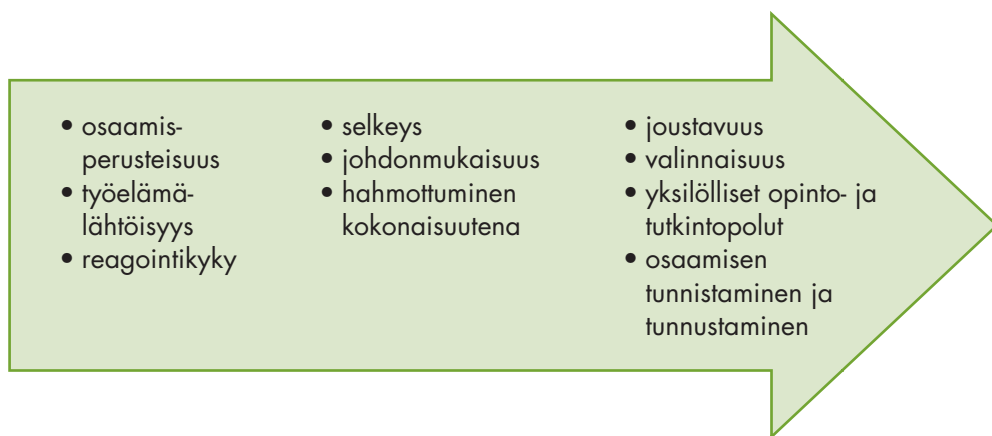
Kuva 1. Tutkintojärjestelmän ja tutkintojen perusteiden kehittämisen tahtotila

Näiden uusien ammatillista peruskoulutusta koskevien säädösten mukaisesti on koulutus 1.8.2015 lähtien toteutettava niin, että siinä otetaan huomioon lainsäädännön voimaantuloon liittyvät siirtymäsäännökset.