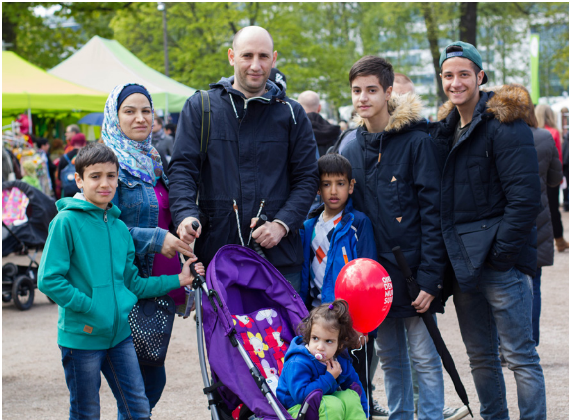
Yhteiset tapaamiset perhekunnittain tarjoavat nuorille tilaisuuksia tutustua.

”Kiitos isä”, Mehdi sanoi helpottuneena ja nousi mennäkseen huoneeseensa. ”Muistathan sitten”, äiti pysäytti hänet. ”Esiliinan”, Mehdi jatkoi äidin lausetta ja vastasi: ”Kyllä muistan, äiti.” Hän tiesi, että olisi sopimatonta ja oikeastaan loukkaavaakin pyytää muslimityttöä kanssaan kahden ulos. Milla ja Niklas samalta vuosikurssilta voisivat tulla myös, jos mentäisiin puistokahville, Mehdi päätti. Samalla hän voisi kysyä, tulisiko Zohra perheensä kanssa kylään.