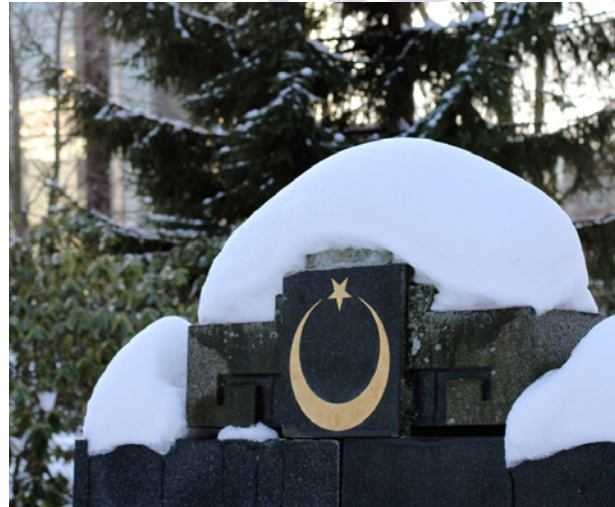
Tataareilla on Helsingissä hautausmaa, jossa noudatetaan islamilaista hautaamista.

Profeetta Muhammed on sanonut, että muslimien tulee haudata vainaja mahdollisimman pian kuoleman jälkeen. (Abu Dawud, Bukhari ja Muslim)