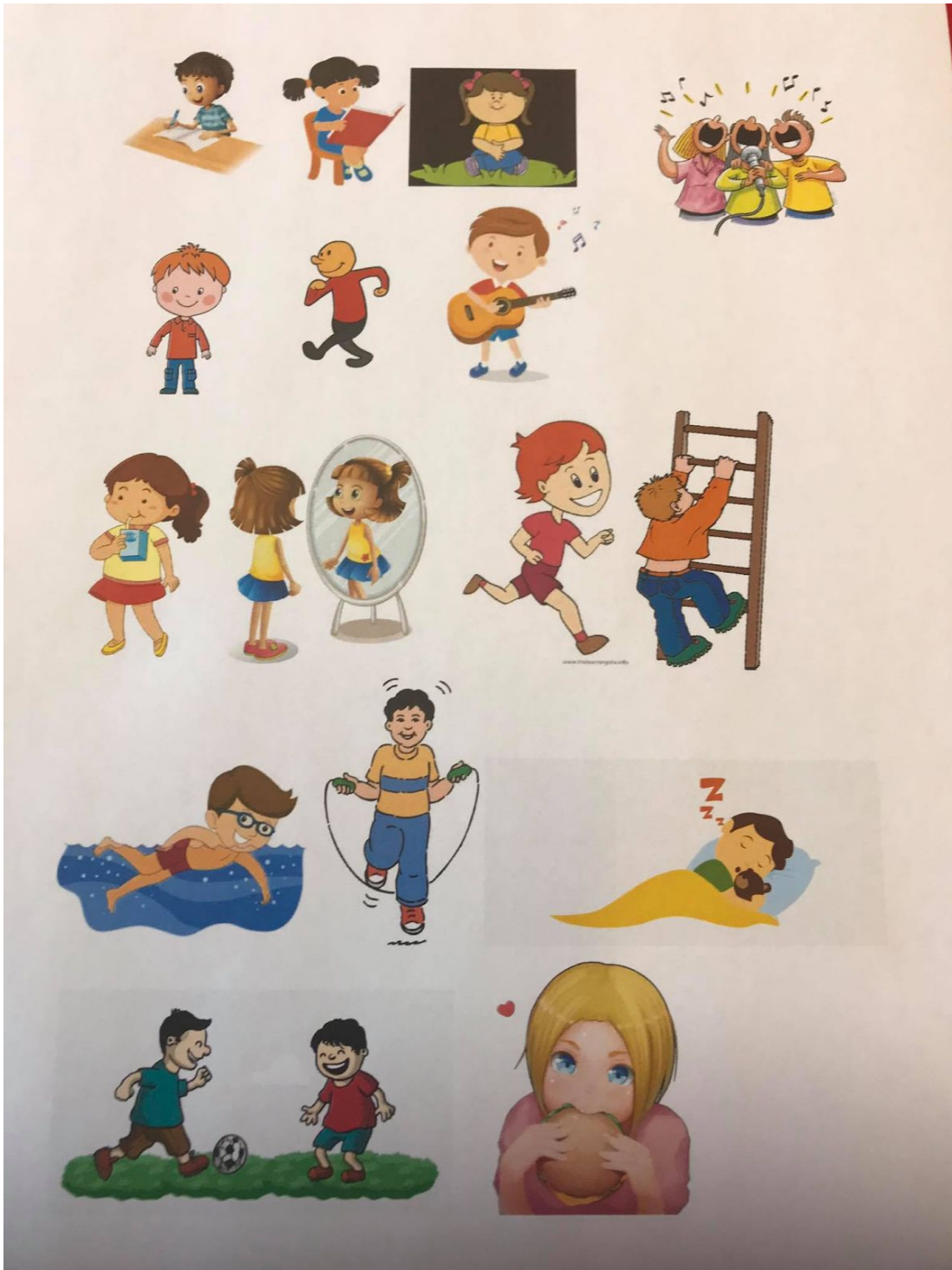
Bilderna på verben som användes