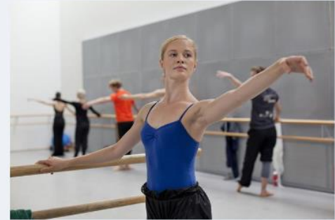
Erasmus+ aikuiskoulutukselle →