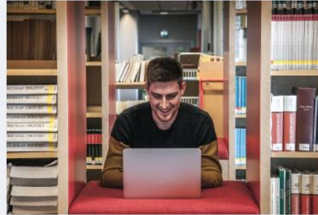
Erasmus+ korkeakoulutukselle →