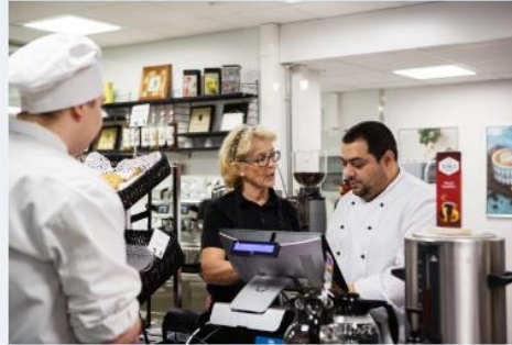
Erasmus+ ammatilliselle koulutukselle →