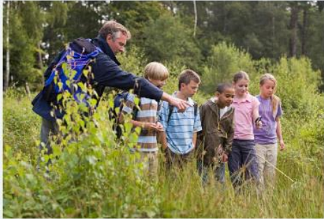
Erasmus+ yleissivistävälle koulutukselle →