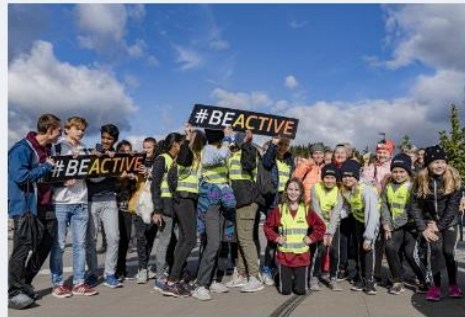
Erasmus+ liikunnalle ja urheilulle - Sport →