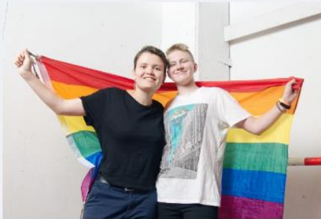
Erasmus+ nuorisovalle →