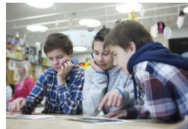
Toinen kotimainen kieli ja vieraat kielet vuosiluokilla 3-6 ja 7-9