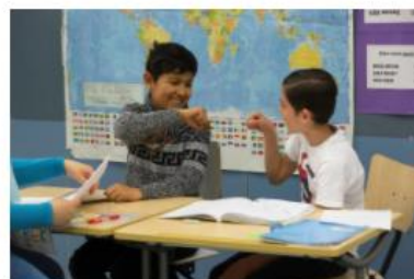
Kieli koulun ytimessä - näkökulmia kielikasvatukseen