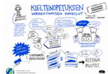
Kielten kärkihankkeet ja kielenopetuksen kehittäminen