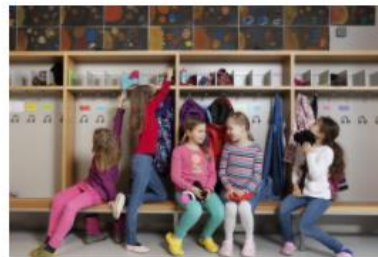
Vuosiluokkien 1-2 A1-kielen opetus