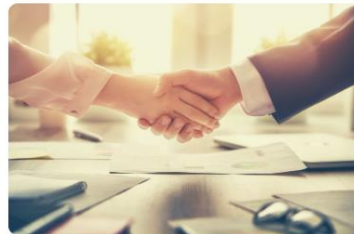
VAIKUTTAMINEN JA EDUNVALVONTA

Pohjola-Nordenin liittotoimisto sijaitsee Helsingissä ja vastaa valtakunnallisesta ja yhteispohjoismaisesta toiminnasta kuten liittokokouksista, erilaisista seminaareista, edunvalvonnasta, pohjoismaisista projekteista, koulun alan matkoista ja apurahoista, Pohjola-Nordenin lehdestä ja jäsenrekisteristä. Pohjola-Nordenin alueellisesta ja paikallisesta toiminnasta vastaavat kuusi aluetta ja yli 80 yhdistystä.