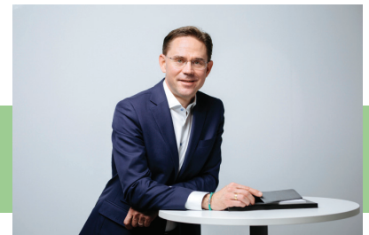
Jyrki Katainen