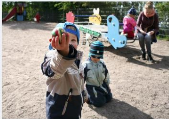
→ Ordnanande av småbarnspedagogik från och med 1.1.2021