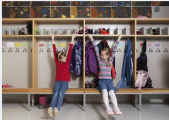
→ Deltagande och frånvaro i den grundläggande utbildningen från och med 1.1.2021