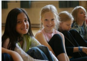
→ Ordnanande av morgon- och eftermiddagsverksamhet från och med 1.1.2021