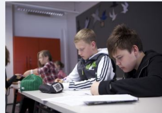
→ Ordnanande av grundläggande utbildning från och med 1.1.2021