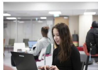
→ Olika sätt att genomföra distansundervisning inom yrkesutbildningen