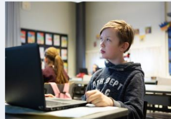
→ Bedömningen av lärandet och kunnandet i den grundläggande utbildningen våren 20...