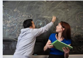
→ Ordnanande av gymnasieutbildning från och med 1.1.2021