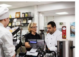
→ Ordnanande av yrkesutbildning från och med 1.1.2021

https://www.opf.fi/sv/utbildning-och-examina/undervisningsvasendet-och-coronaviruset