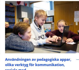
→ Användningen av pedagogiska appar, olika verktyg för kommunikation, sociala med...