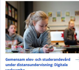
→ Gemensam elev- och studerandevård under distansundervisning: Digitala verksamhe...