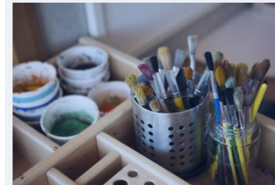
→ Ordnanande av grundläggande konstundervisning fr.o.m. 1.1.2021