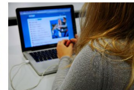
→ Hur ska man gå till väga om det förekommer mobbing på nätet?