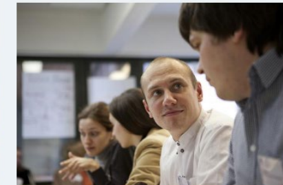
→ Genomförande av utbildning inom fritt bildningsarbete fr.o.m. 1.1.2021