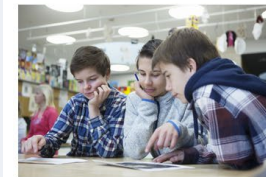
→ Enkät om ungas välbefinnande i distansundervisningen