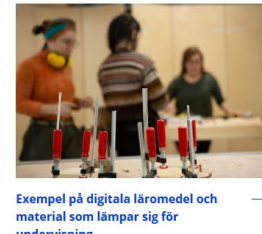
→ Exempel på digitala läromedel och material som lämpar sig för undervisning