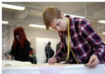
→ Ordnanande av yrkesutbildning och samarbete med arbetslivet från och med 1.1.2021