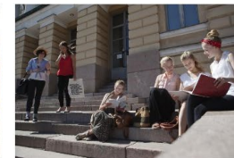
→ Lärandet kan främjas också på sommaren

https://www.opf.fi/sv/utbildning-och-examina/undervisningsvasendet-och-coronaviruset