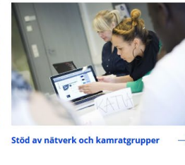
→ Stöd av nätverk och kamratgrupper