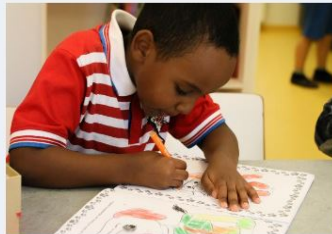
→ Ordnanande av förskoleundervisning från och med 1.1.2021