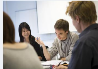
→ Ordnanande av grundläggande utbildning för vuxna under vårterminen 2021