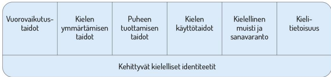
Kuvio 1. Lasten kielen kehityksen keskeiset osa-alueet esiopetuksessa