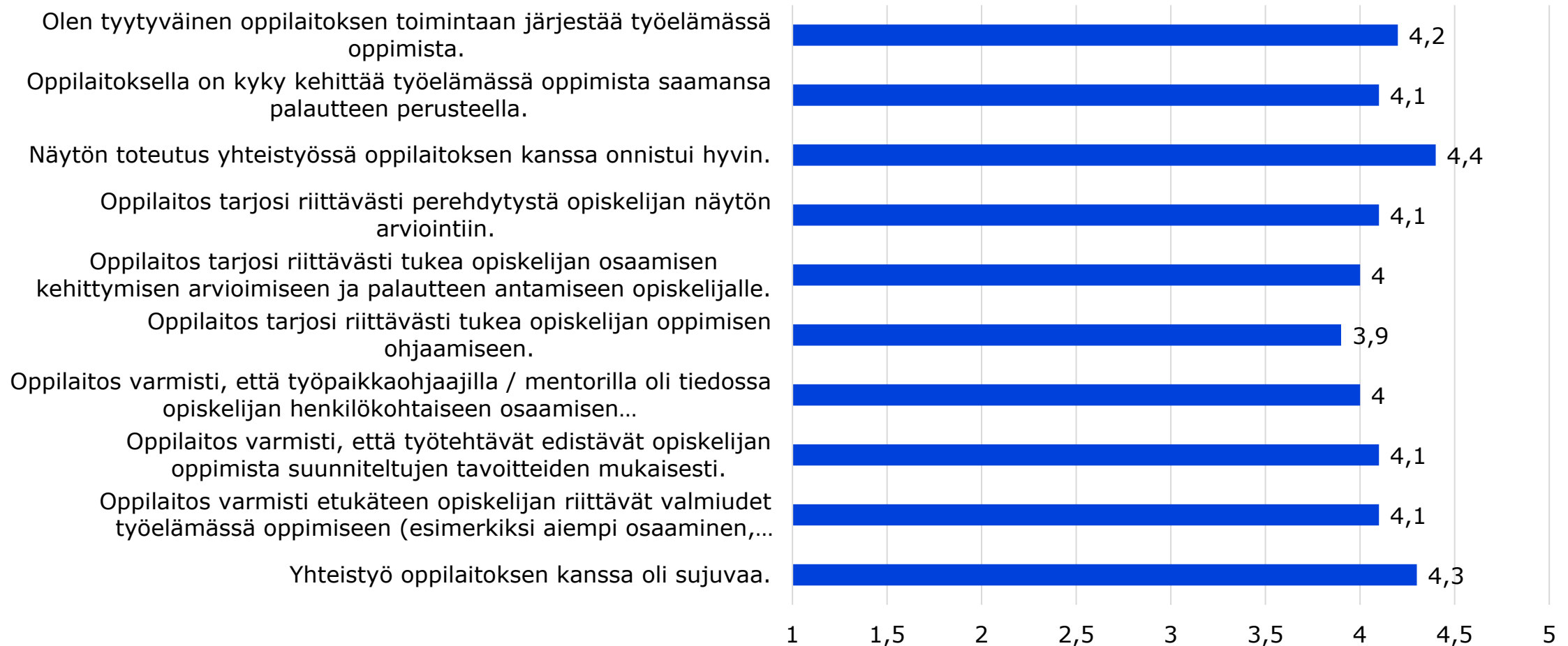
Työpaikkaohjaajien kysely 7/2021-6/2022