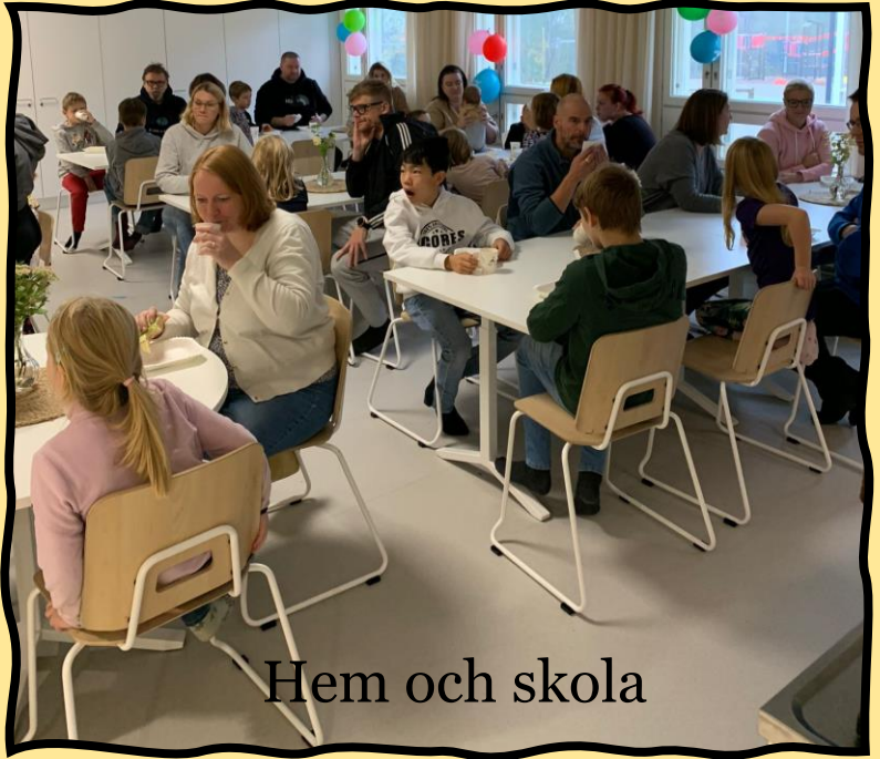
Hem och skola