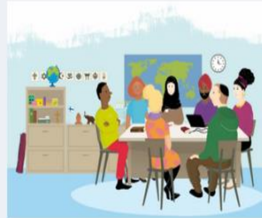
Katsomuskasvatuksen yhteistyö - Keiden kanssa?