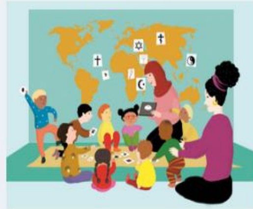
Suunnitelmallista katsomuskasvatusta - Miten?