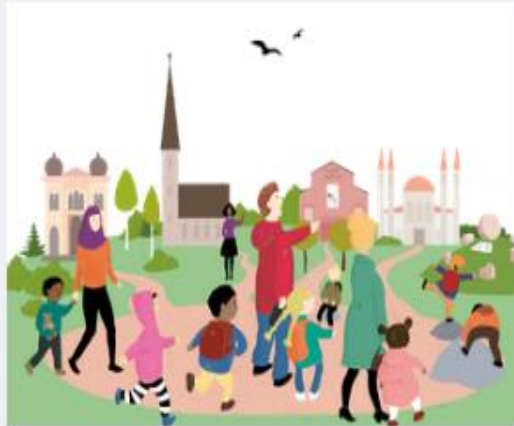
Perusteltua katsomuskasvatusta - Miksi?

Katsomuskasvatus on osa yleissivistävää varhaiskasvatuksen ja esiopetuksen pedagogista toimintaa. Katsomuskasvatuksen tavoitteena on edistää keskinäistä kunnioitusta ja ymmärrystä eri katsomuksia kohtaan sekä tukea lasten kulttuurisen ja katsomuksellisen identiteetin kehittymistä.