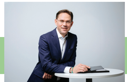
Jyrki Katainen