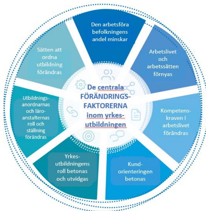
Figur 3. Yrkesutbildningens centrala förändringsfaktorer

Förändringarna som sker i verksamhetsmiljön påverkar yrkesutbildningen, dess kvalitetsledning, anordnandet av utbildningen och på hur och var man i framtiden skaffar sig yrkeskompetens. De centrala förändringsfaktorerna presenteras i figur 3 och bakgrunden till dem i bilaga 1.