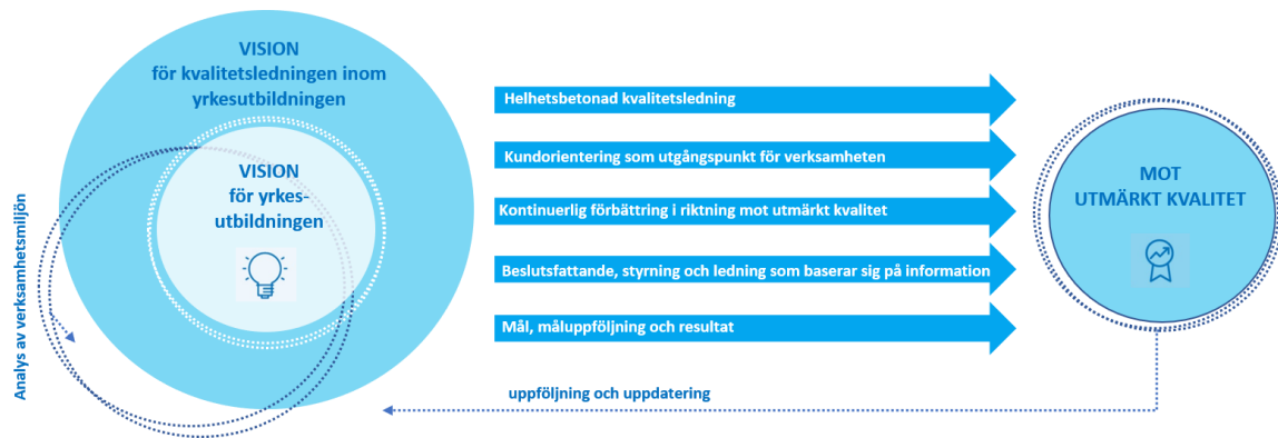
Figur 1. De centrala elementen och innehållet i kvalitetsstrategin för yrkesutbildningen.

Aktörerna inom yrkesutbildningen är aktörer som med sin egen verksamhet inverkar på yrkesutbildningens kvalitet och kvalitetsledning samt på utvecklingen av dem och med vilka man tillsammans producerar utbildningstjänster. I bilden nedan presenteras dessa aktörers centrala roller och uppgifter. Yrkesutbildningen genomförs allt oftare i olika partnerskaps- och samarbetsnätverk, där också andra samarbetspartner och intressenter ingår.