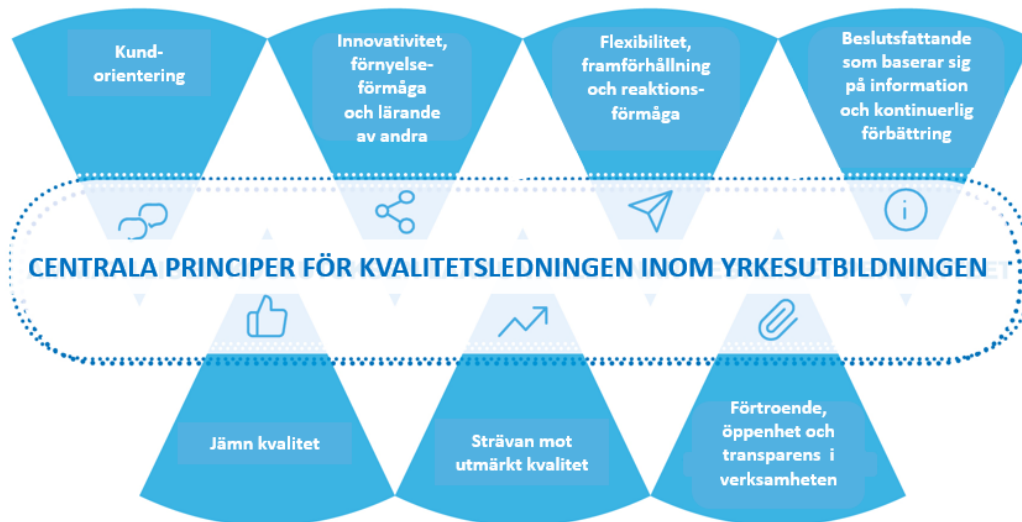
Figur 5. Centrala principer för kvalitetsledning inom yrkesutbildningen.

De centrala principerna för kvalitetsledning inom yrkesutbildningen presenteras i figur 5 och bakgrundsfaktorerna till visionen för kvalitetsledning i bilaga 3.